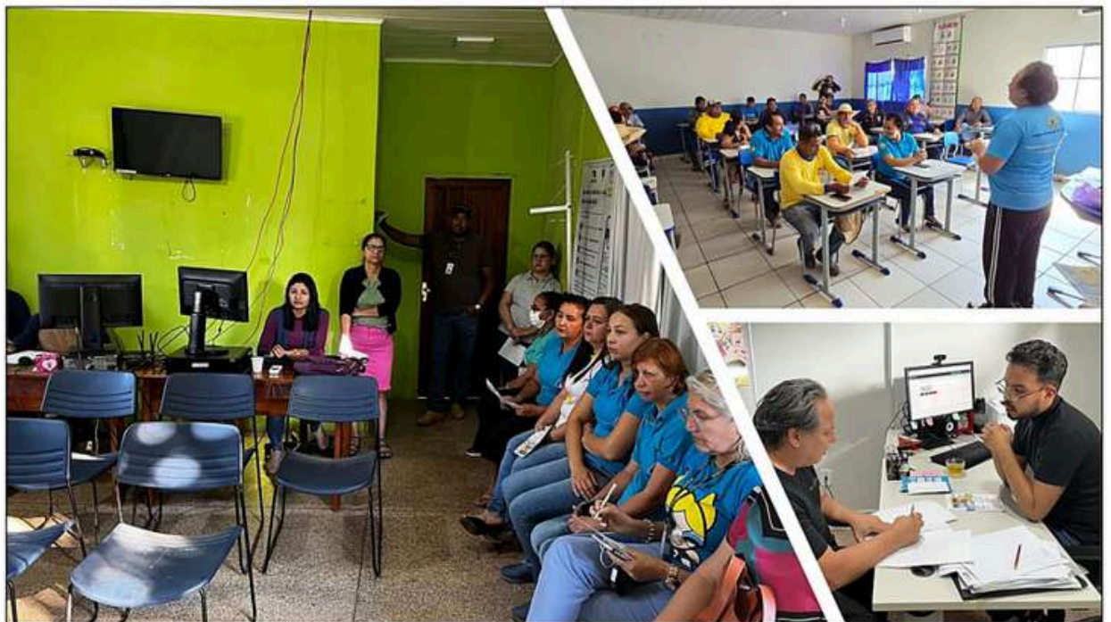
Imagem 03: Agrupamento de Imagens do Projeto Conversando sobre Previdência