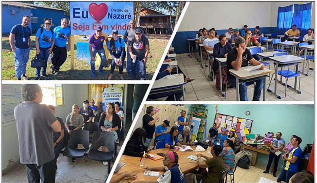
Imagem 02: Agrupamento de Imagens do Projeto Conversando sobre Previdência

Fonte: Coordenadoria de Previdência, 2024