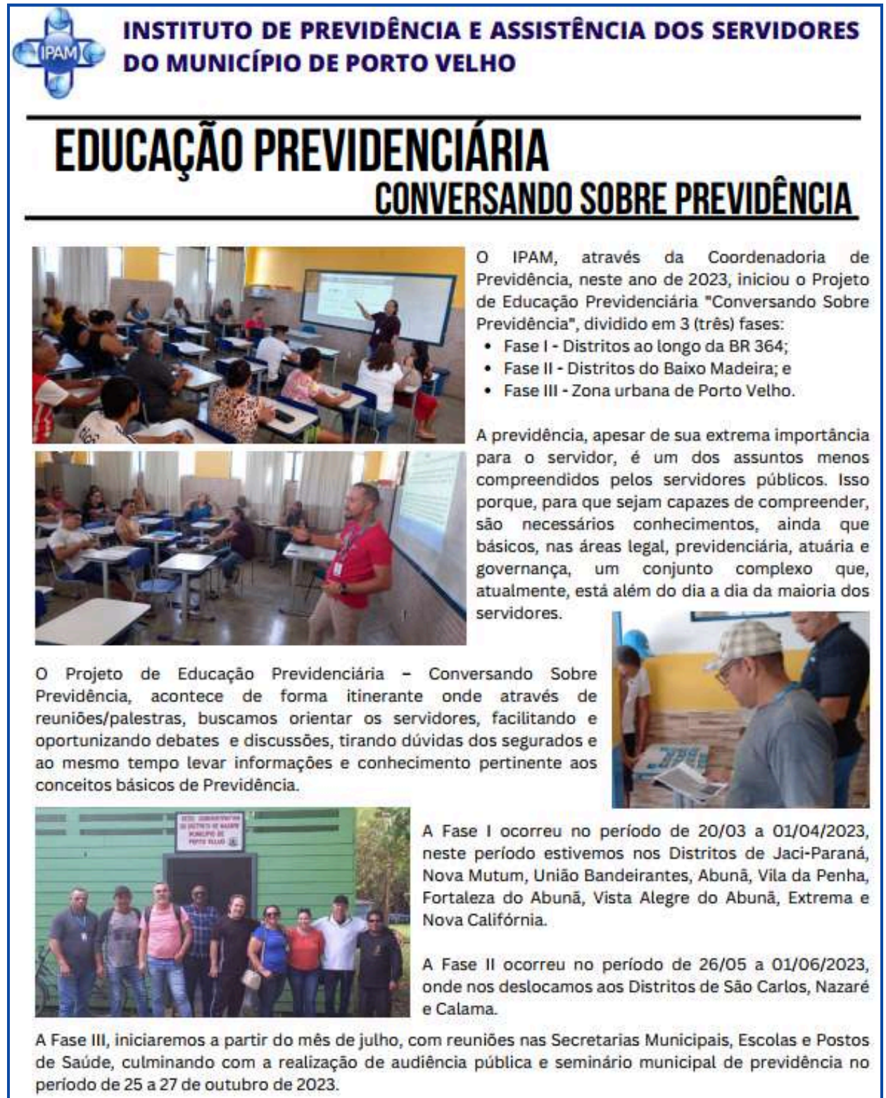
Imagem 01: Relatório Resumido da Educação Previdência- Projeto: Conversando sobre Previdência em 2023