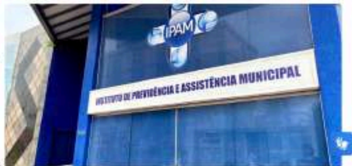
Audiência Pública do Ipam será na quarta-feira (25), a partir das 8h, no Teatro Banzeiros

Conforme o coordenador, a realização das audiências públicas e seminários municipais de previdência desempenham um papel fundamental na transparência e participação cidadã, avaliação de desempenho, capacitação e troca de experiências, alinhamento com o Programa de Certificação