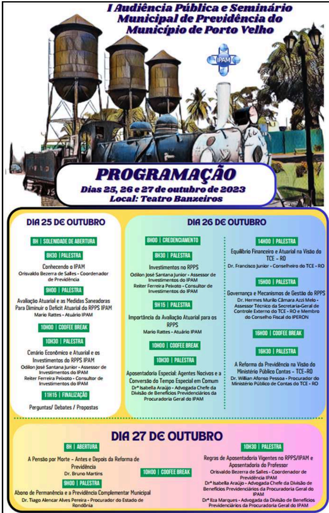
Imagem 02: Programação da 1ª Audiência Pública e Seminário de Previdência